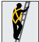
Ascenso - Descenso